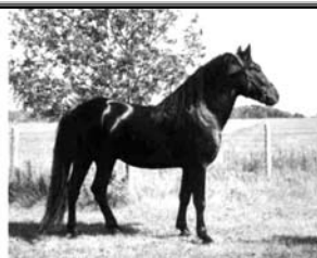
Fantasia Brillant Corro, 6506