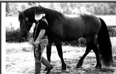
Fantasia Grand-Maître Duce, 6508