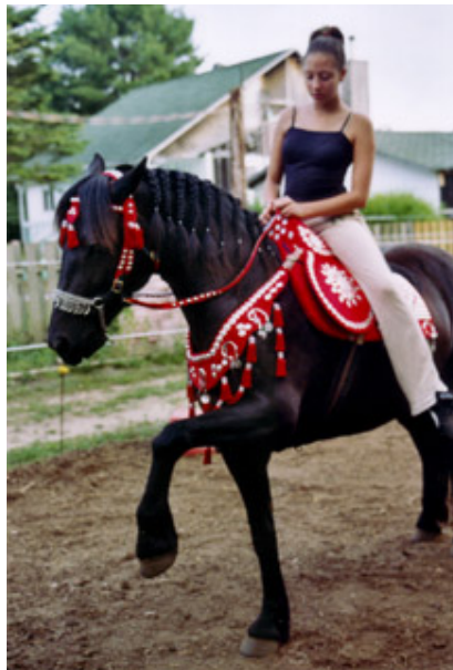
Des Aulnais Yukon Joée en selle de spectacle arabe : suite de la jambette et début du pas espagnol

Apprendre par étapes : Au début, après deux autres exemples où vous l'aidez en lui montrant ce que vous