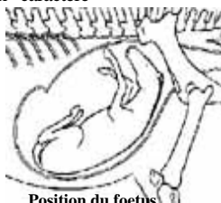
Position du fœtus

Éventuellement, une membrane luisante semi transparente et blanchâtre apparaît à la vulve, c'est l'amnios, enveloppe interne qui enrobe le fœtus durant le passage dans le canal pelvien. Après quelques contractions, on observe habituellement à l'intérieur de l'amnios, un membre puis un deuxième puis le museau du poulain. En présentation normale, la face plantaire des membres antérieurs fait face au sol et la tête repose sur les carpes. Une fois la tête bien dégagée de la vulve, il peut être indiqué de déchirer manuellement l'amnios afin de permettre (Suite p. 5)