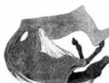
Fœtus après expulsion