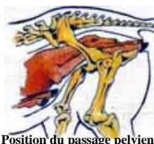
Position du passage pelvien