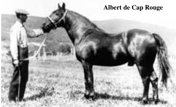
Albert de Cap Rouge

Le 31 mai 1913 fut certainement un grand jour dans les annales de la race Canadienne car ce jour-là naquit un poulain noir : Albert de Cap-Rouge n° 1489 (issue de l'union des deux qui viennent d'être mentionnés). Le 2 juin, il pesait 110 livres. Comme la mère, Hélène, avait beaucoup de lait, à 3 mois il pesait 465 livres. Il fut sevré à 5 mois et fut hiverné dans un hangar de planches, à devant ouvert. Jamais on ne le vit frissonner une seule fois quoiqu'il passât presque tout son temps dehors. À 12 mois, il pesait 750 livres et à 38 mois, il pesait 1210 livres soit un peu plus que son père! Une fois entièrement développé, c'était un cheval de 1300 livres pendant la saison de saillie, et de 1350 en dehors de la saison.