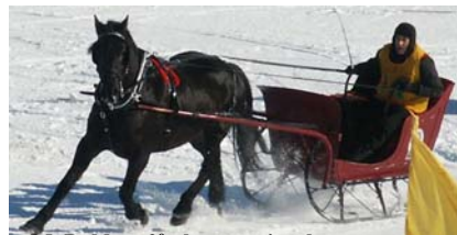
M. Bolduc, 2 e place en simple

Ce jour-là, le soleil était resplendissant, tellement qu'on se serait cru au printemps avec un mercure avoisinant le point de congélation. Je m'étais même