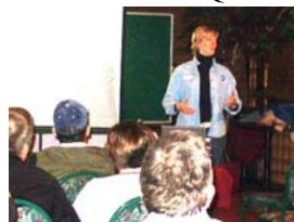
Clinique sur l'alimentation

Le 5 février dernier, plus d'une vingtaine de membres se sont réunis à l'Hôtel Quatre-saisons, près de Drummondville, pour une journée de formation et d'information qui s'est révélée extrêmement intéressante.