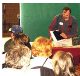
Clinique sur la génétique et génétique du cheval Canadien