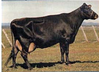
la vache Canadienne,