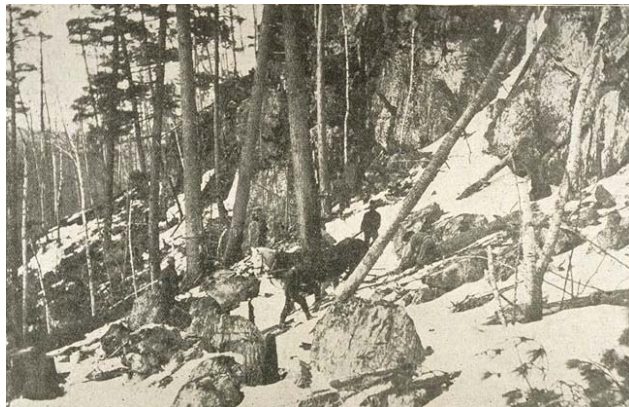
Défricheurs canadiens en forêt, L'Album Universel, avril 1906