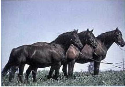
« Le cheval Canadien,

Un projet collectif pour assurer la survie et la pérennité des races animales du patrimoine agricole du Québec