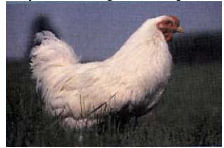
la poule Chantecler »

Conformément à la loi # 199 du Gouvernement du Québec Désignés sous le titre de « Races patrimoniales du Québec »